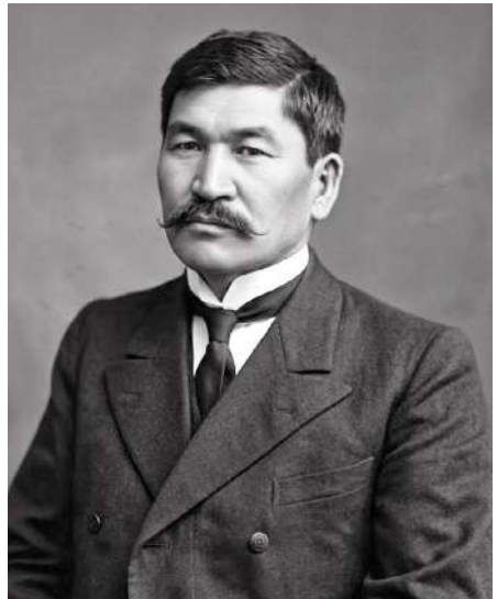
Алаш көсемі Әлихан Бөкейханов

Бөкейханов: «Қытайды Жапон билемек, пайдаланбақ. Қытайдың ақша, теміржол, оқу министрлігі мекемесінде жапон ақылшы кісі ұстайды», — деп, Жапонияның Қытайды бағындыруының экономикалық тиімділігіне көбірек үніледі.