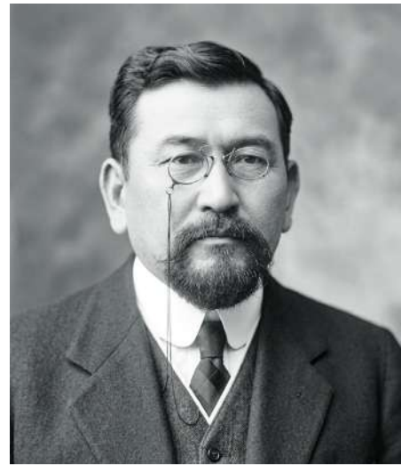
Ұлт ұстазы Ахмет Байтұрсынұлы

Ж апон тақырыбына қалам тартуға келгенде Мұхаң жалғыз емес еді. Қазақстанды ғана емес, бүкіл Орта Азияны, Кавказ жұртын түгелдей жаулап, отаршылдық қамытын баса енгізіп, тыпыр еткізбей отырған Ресейдей алып империяның Қиыр Шығыстан басталған кезекті амбициялық жобасы – «Желтороссияның» тамырына балта шапқан алақандай Жапонияның алапат табыстарын қазақ зиялы қауымы қуана қабылдады.