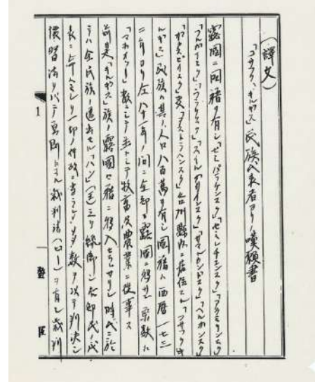
Профессор Т. Уяма тапқан Р. Мәрсековтің Жапон үкіметіне жолдаған хаттың бір бөлігі

дегі аудармасын (түпнұсқа табылмаған) Жапония Сыртқы істер мұрағатынан тауып, Алаш автономиясының халықаралық байланыстарына қатысты аса маңызды құжатты жарыққа шығарды.